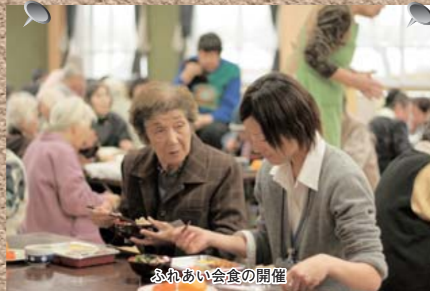
ふれあい会食の開催